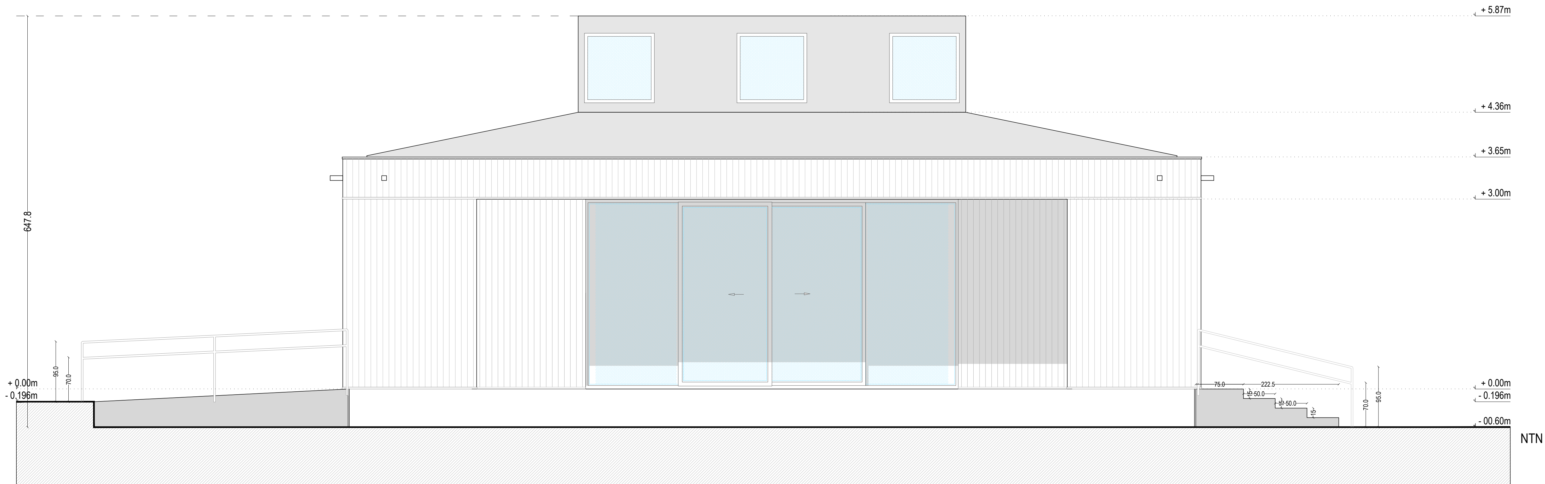
Elevación Norte Escala 1.50

ARQUITECTOS ALEJANDRA BANCALARI CORNEJO. CARLOS CORONADO PLENENCIA. VALENTINA CHANDIA ARRIAGADA.